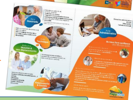
Nouvelle plaquette des services