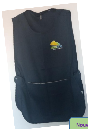
Nouvelle blouse de travail